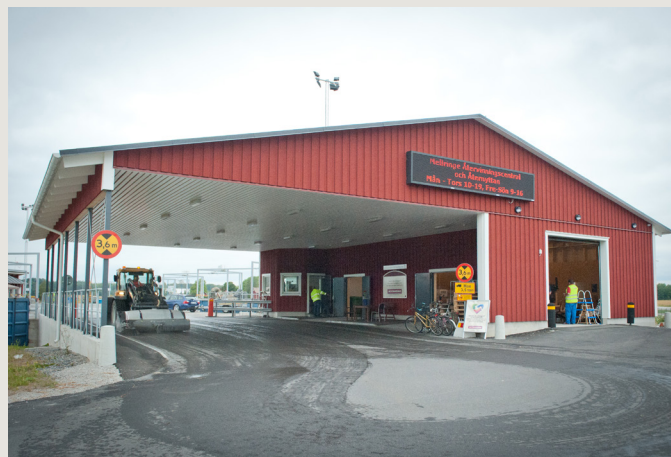
Åternyttan hittar du på Mellringe återvinningsstation. Åternyttan bemannas enligt ett rullande schema av hjälporganisationerna Bra och Begagnat, Myrorna och Röda Korset.

Gå in på orebro.se/avfall – eller ring oss på 019-21 10 00 .